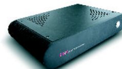
EMA-S40 Appliance Server